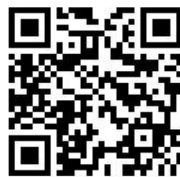
お申し込みフォーム

右のQRコードから表示されるフォームよりお申し込みください。 QRコードの読み込みができない場合は、 https://ws.formzu.net/sfgen/S97601008 から表示されるフォームで お申し込みください。