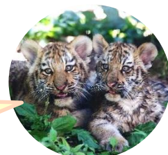
旭山動物園の アムールトラのふたご

お問い合わせ先 多胎育児サークルハッピーキッズ旭川支部 no9forum.asahikawa@gmail.com